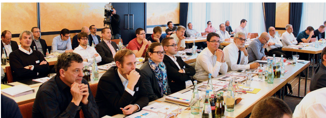
112 Teilnehmer waren bei der Veranstaltung zugegen

Doch bevor ein Verpackungsdrucker groß in irgendwelche Maschinen- und Prozesslösungen investiert, muss er sich im Klaren sein, wie er sein Unternehmen für die Zukunft wappnen möchte. Hierbei sind die Analyse der aktuellen Auftragsstruktur und der vorhandenen Produktionstechnologie, die Entwicklung der Märkte sowie die strategische Ausrichtung entscheidende Punkte. Denn die Vielfalt an flexiblen Verpackungen ist sehr hoch, so dass man sich auf bestimmte Segmente konzentrieren sollte.