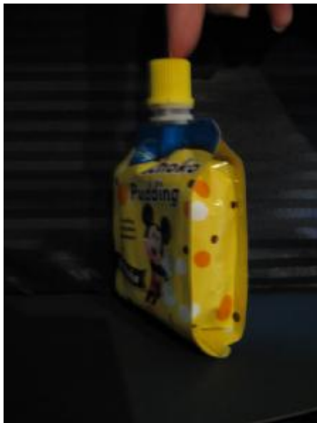
Cheerpack aus Japan (auch Gualapack)

Ein kleiner Teil an Fruchtsaft im Beutel von unter 5% wird in Japan unter dem Namen Cheerpack verkauft. Dies ist ein Beutel mit einem Ausgießer und einer Konstruktion mit zwei Seitenfalten. Der Verkaufspreis ist entsprechend 3-mal höher als der klassische Capri Sonne Beutel, auch wenn der Cheerpack keine Standfähigkeiten hat. Die ist besonders auf den Wiederverschluss und die Marktgegebenheiten in Japan zurück zu führen. Unter dem Namen Guala wird in Europa ein ähnliches Produkt mit Ausgießer verkauft. Die nachstehend abgebildeten Beutel erfreuen sich besserer Preise, sind aber wenig bekannt.