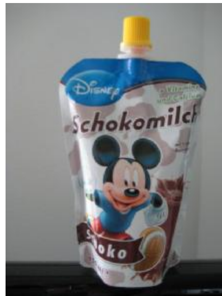
Die klassische Form des Standbeutels